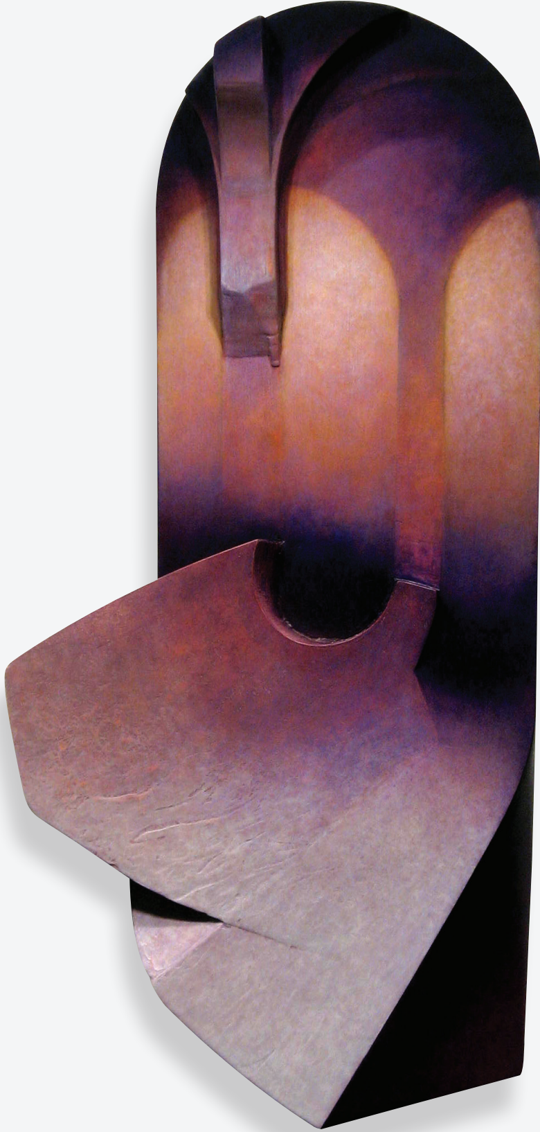
Serdar Arat, "Untitled", 2010, tahta üzerine akrilik, 35 x 17 x 2 cm