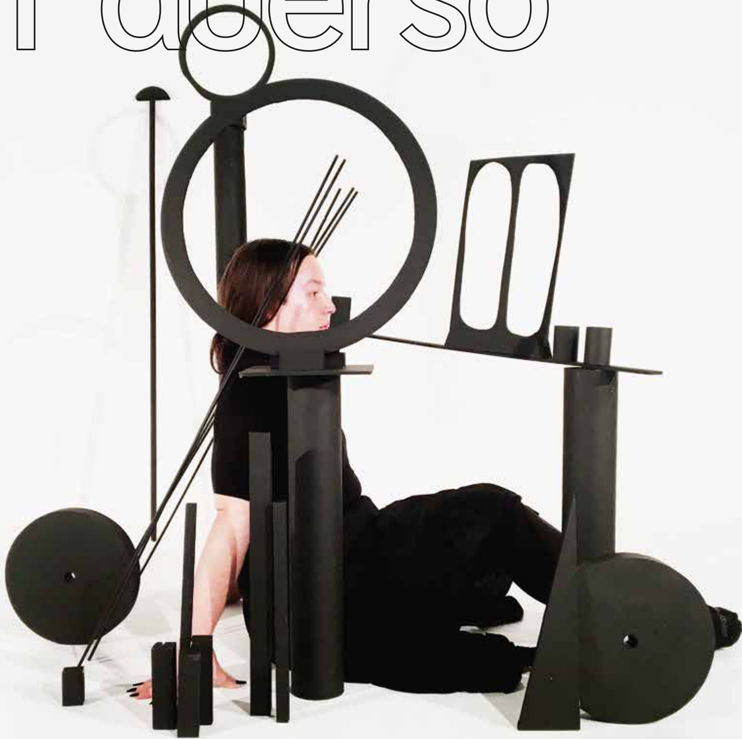
You Destroy Every Special Thing I Make (video still 3), 2017–2019, 4-Kanal-Video/four-channel video, 10:00 min.