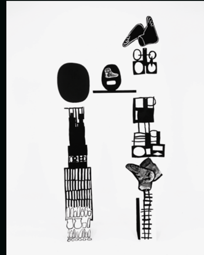
You Destroy Every Special Thing I Make (studio installation), 2017–2019, bemaltes Holz und Leinwand/painted wood and canvas, 120 x 244 cm, Atelleraufnahme/studio installation shot.