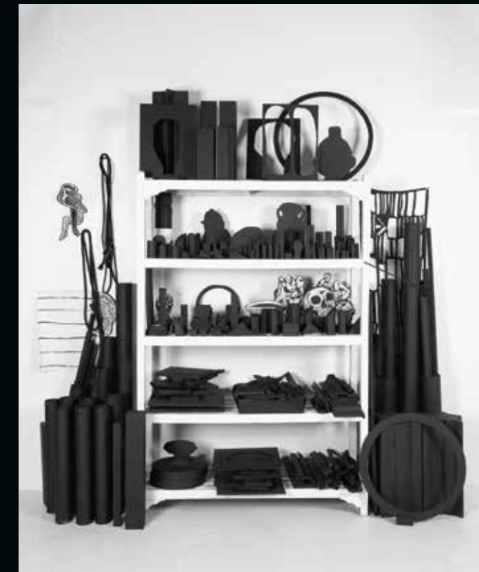
You Destroy Every Special Thing I Make (props), 2017–2019, bemaltes Holz und Leinwand/painted wood and canvas, 305 cm x 305 cm, Atelleraufnahme/studio installation shot.