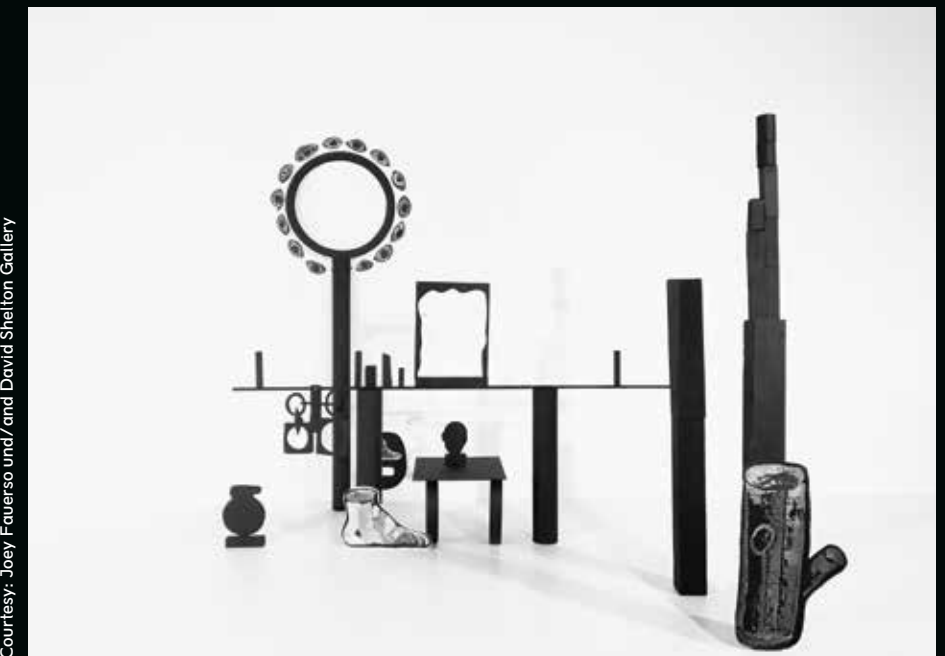
You Destroy Every Special Thing I Make (video still 1), 2017–2019, 4-Kanal-Video/four-channel video, 10:00 min.