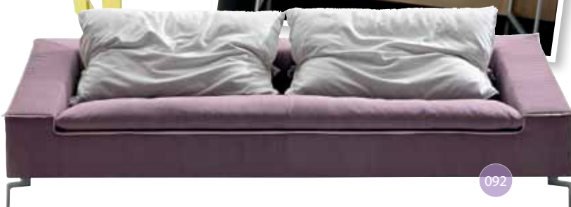
077. Tag Heuer Link. Es el primer teléfono inteligente de lujo con pantalla táctil. 078. SiTable. El diseño de esta pieza de UN Studio permite ser un punto de encuentro social. 079. Mesa de café en color verde de Saba Italia. 080. Extension Chair. Diseño de Sjoerd Vroonland para Mooi. 081. Bau de Normann Copenhagen. Una obra escultórica diseñada por Vibeke Fønnesberg Schmidt. 082- Boutique Diary. Creado por Marcel Wandres para Mooi. 083. Aretes de Berger. Coral y diamantes son una combinación única y fascinante. 084. Sillón modular bitono de espalda alta diseñado para Saba Italia. 085.- Reloj de la colección Calibre de Cartier confeccionado en acero pulido. 086. Perchero Branch. Está fabricado en aluminio reciclado y es de la firma Neko. 087. Bolsa de Louis Vuitton. Lockit Devotion de piel de cocodrilo en color verde intenso y detalles de latón. 088. Espejo de Soviet Italia de marco laqueado y diferentes terminados. 089. Nest de Markus Johansson. Sus formas espontáneas captan todas las miradas. 090. Rody. Ritmo y simplicidad definen esta pieza de Mixcv. 091. Consola de Soviet Italia con estructura cromada. 092. Tomando la idea de un cojín de grandes dimensiones, este sofá de Saba Italia ofrece comodidad y estilo.