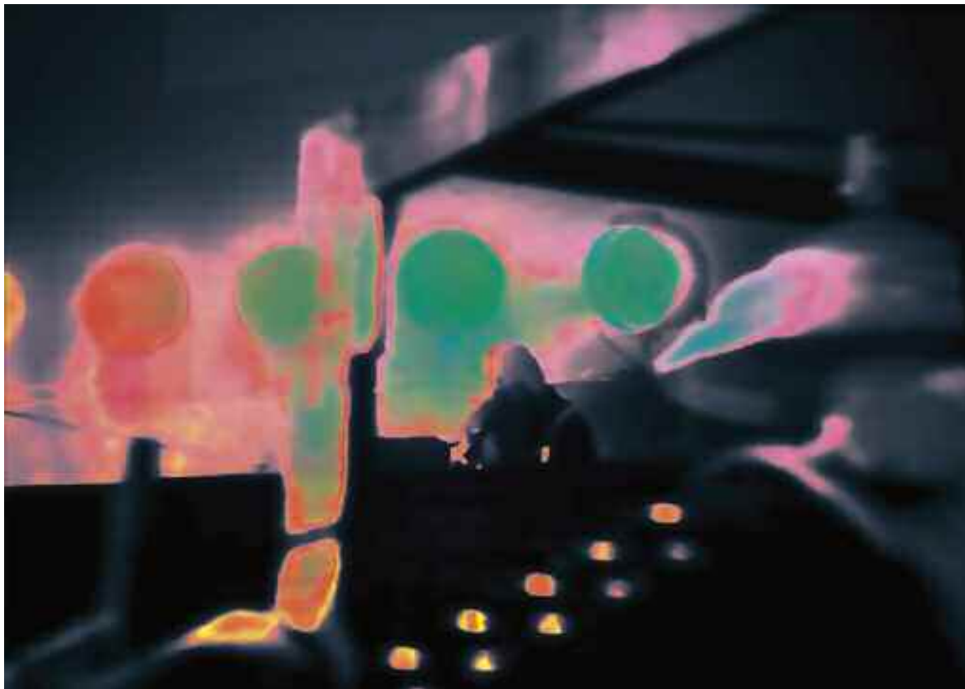
THE SHOOTING (Stalker / Andrej Tarkowskij). 2013 C-Print. Acrylic/Aludibond. 75 x 104 cm. Signed, titled, dated verso. Limited Edition 3 + 2 AP