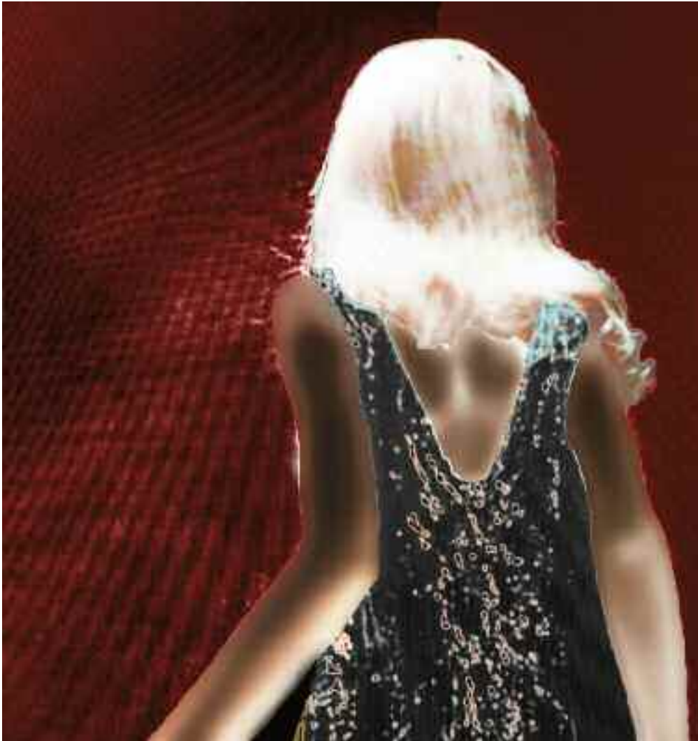
SHOULDERBLADE KISS (Blow Up / Michelangelo Antonioni). 2013 C-Print. Acrylic/Aludibond. 80 x 75 cm. Signed, titled, dated verso. Limited Edition 3 + 2 AP