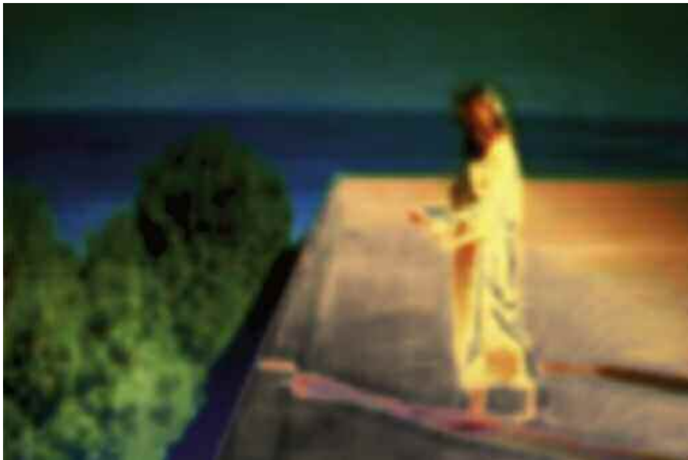
LIMITS OF DESTINY (Die Verachtung / Jean Luc Godard), 2012 C-Print. Acrylic/Aludibond. 90 x 135 cm. Signed, titled, dated verso. Limited Edition 3 + 2 AP

solche „Plot Points“: einer markiert den Wendepunkt des ersten Akts in den zweiten, und zeigt, wie eine Hauptfigur im Konflikt mit ihrer Situation schlagartig begreift, worum es geht. Der zweite Wendepunkt leitet den letzten Akt ein und entscheidet, ob die Geschichte gut ausgeht oder nicht. Da andererseits jedes Bild eines Films in gewissem Sinn ein „Plot Point“ ist, der die Geschichte vorantreibt und „wendet“, war für Jeanne Szilit der Titel ihrer Bildserie naheliegend, wenn er auch eher als Analogie zu verstehen ist.