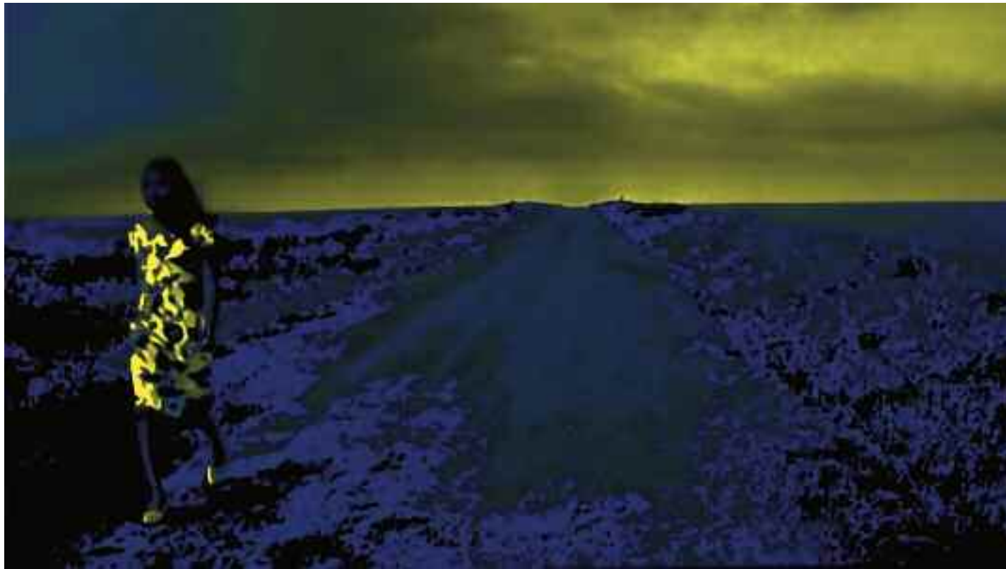
U-TURN OF DESIRE · BLUE (Women without Men / Shirin Neshat). 2013 C-Print. Acrylic/Aludibond. 40 x 72 cm. Signed, titled, dated verso. Limited Edition 3 + 2 AP