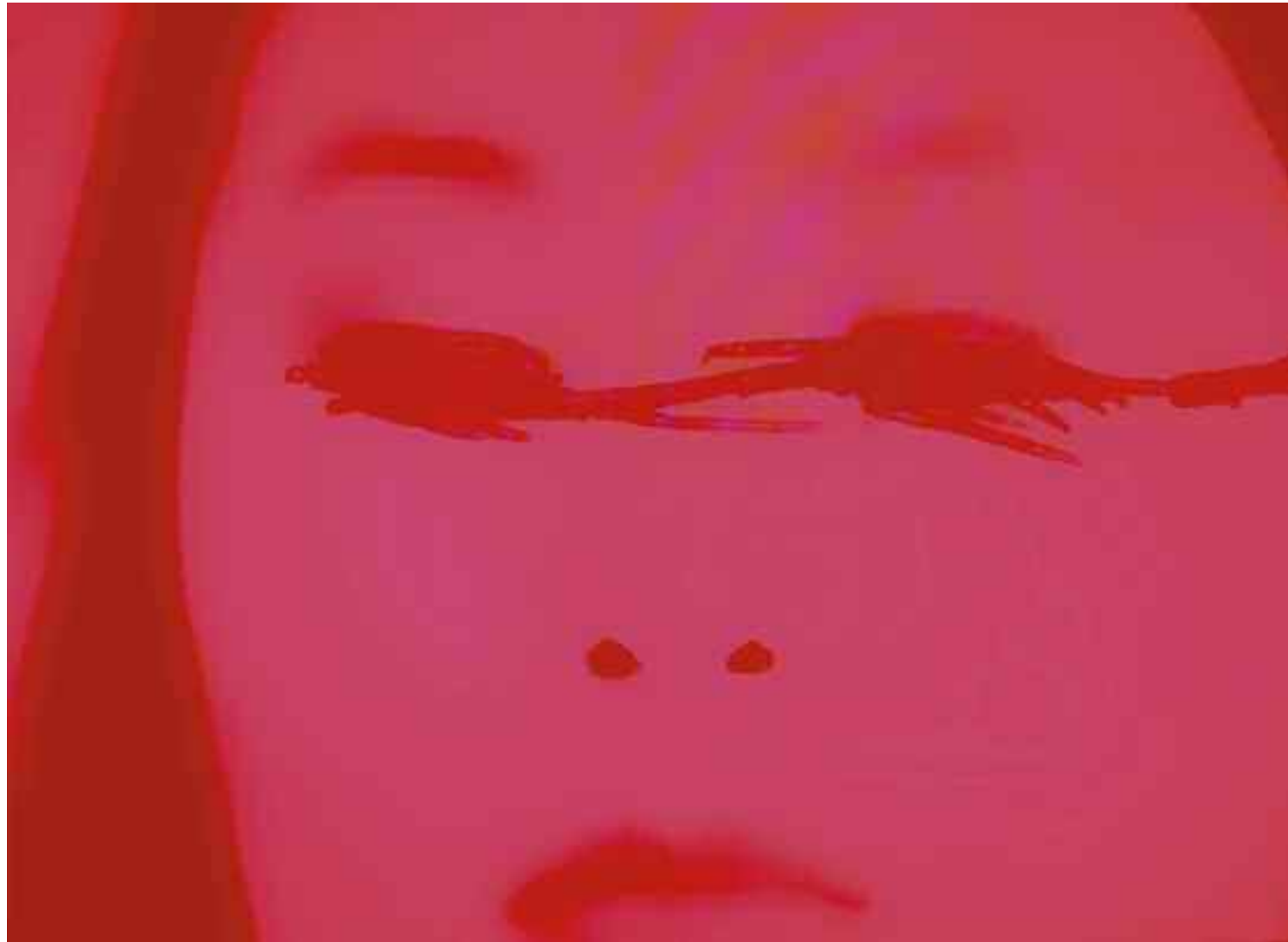
Oben: FADE OUT (Irma Vep / Olivier Assayas), 2013 C-Print. Acrylic/Aludibond. 40 x 54 cm. Signed, titled, dated verso. Limited Edition 5 + 2 AP