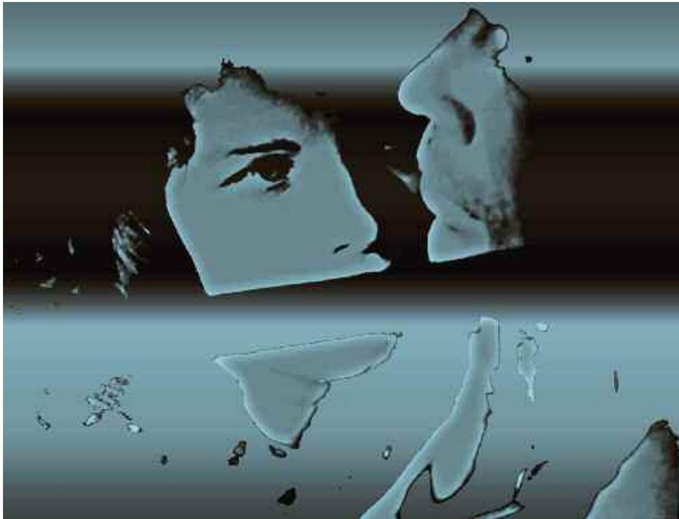
THE YOU-ME-GAME (Das Schweigen / Ingmar Bergman). 2013 C-Print. Acrylic/Aludibond. 70 x 92 cm. Signed, titled, dated verso. Limited Edition 3 + 2 AP