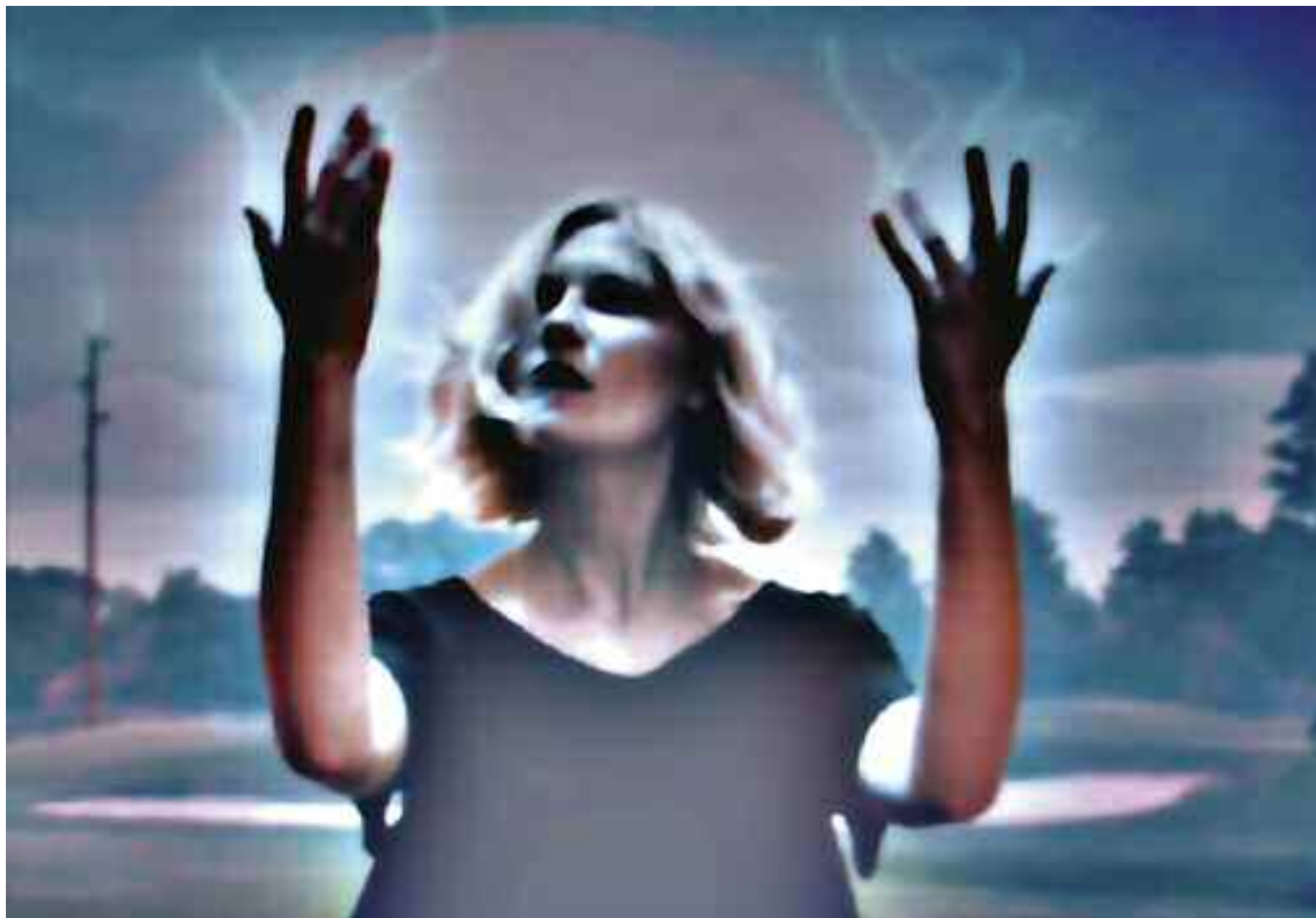
TAKE – DO – SEE (Melancholia / Lars von Trier), 2013 C-Print. Acrylic/Aludibond. 90 x 130 cm. Signed, titled, dated verso. Limited Edition 3 + 2 AP