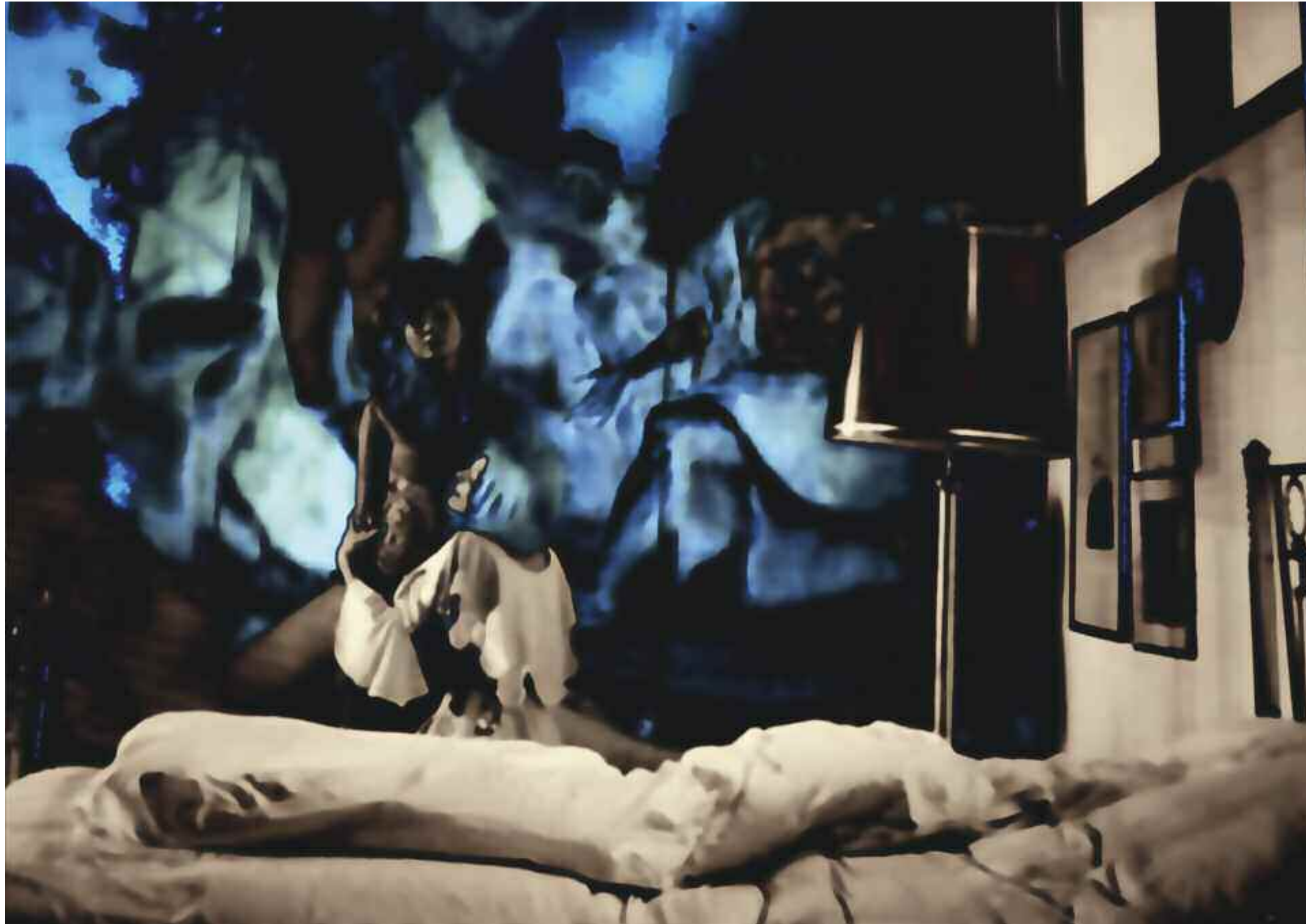
THE STORMY SEA OF THOSE WHO LEAVE (Die bitteren Tränen der Petra von Kant / Rainer Werner Fassbender). 2013 C-Print. Acrylic/Aludibond. 90 x 127 cm. Signed, titled, dated verso. Limited Edition 3 + 2 AP