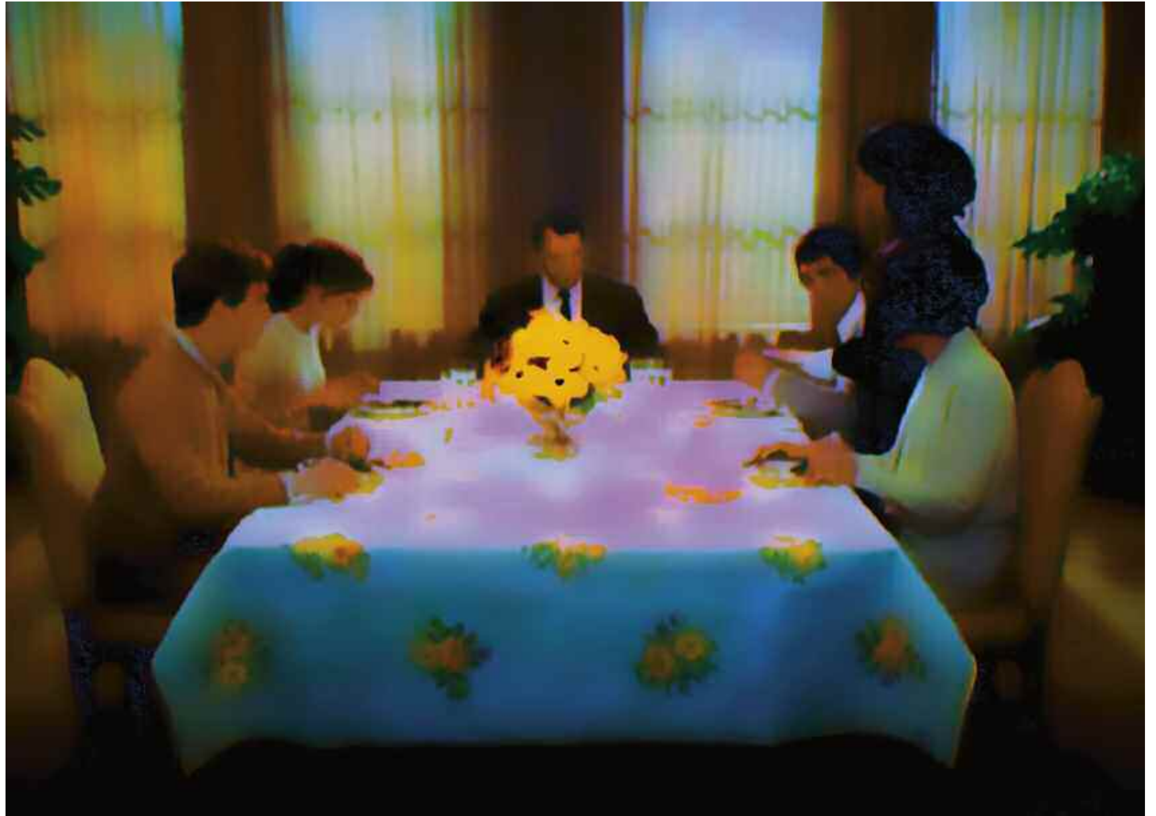
LA FAMIGLIA (Teorema / Pier Paolo Pasolini). 2013 C-Print. Acrylic/Aludibond. 110 x 152 cm. Signed, titled, dated verso. Limited Edition 3 + 2 AP