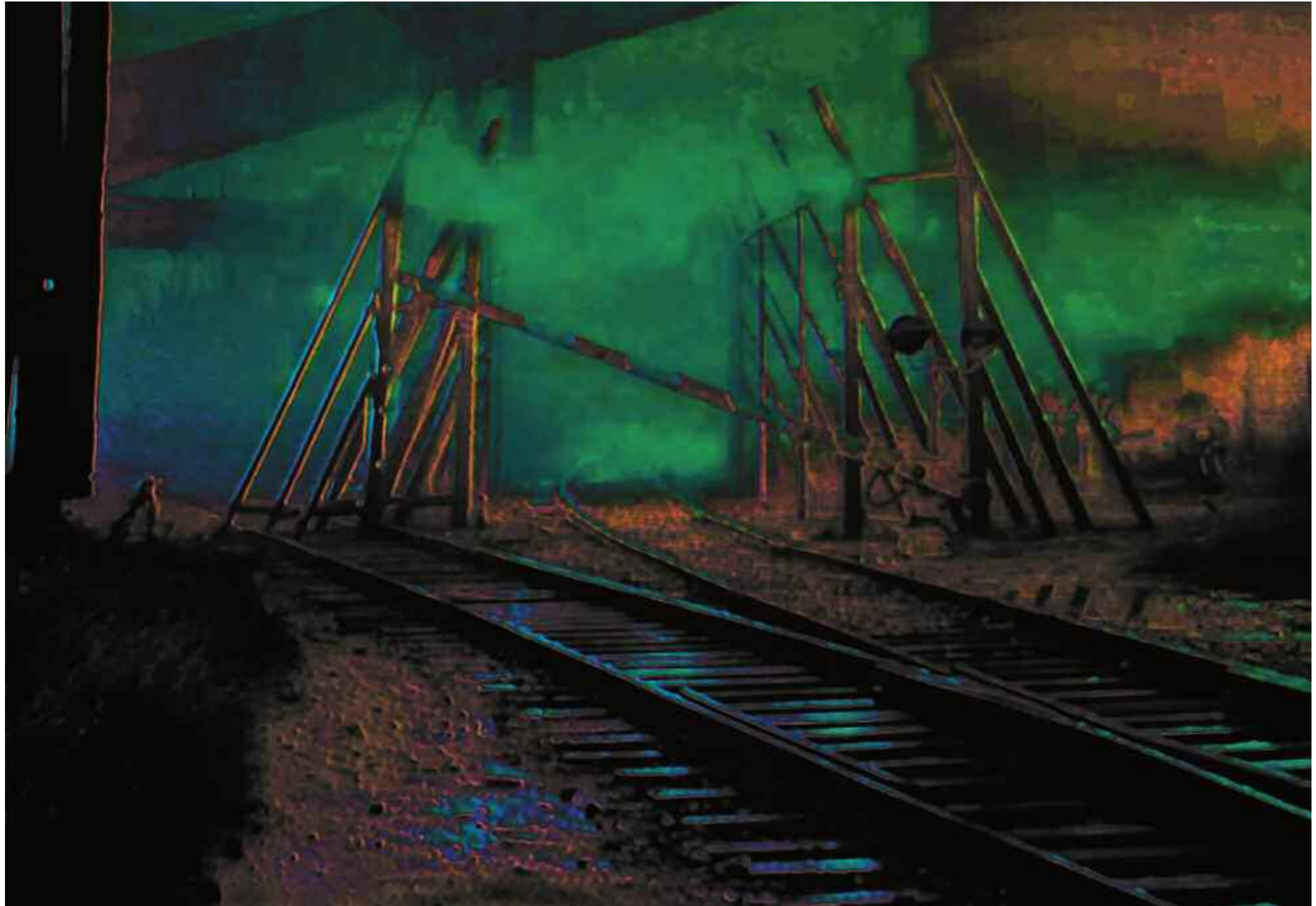
HALLUCINATION ZONE (Stalker / Andrej Tarkowskij). 2013 C-Print. Acrylic/Aludibond. 75 x 109 cm. Signed, titled, dated verso. Limited Edition 3 + 2 AP