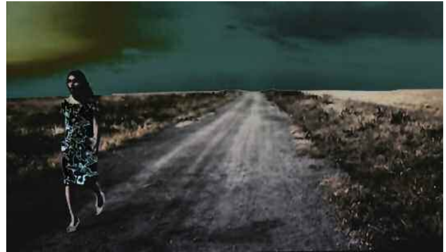
U-TURN OF DESIRE · GREEN (Women without Men / Shirin Neshat). 2013 C-Print. Acrylic/Aludibond. 40 x 72 cm. Signed, titled, dated verso. Limited Edition 3 + 2 AP

„Jeder gesehene Film ein weiteres Leben, so sehe ich das Kino. An die zehntausend Filme habe ich bisher schon erlebt. Somit also zehntausend miterlebte fremde, oft mitreißende, außergewöhnliche Leben neben meinem eigenen banalen. Aus vielen dieser Filme haben sich einzelne Szenen unauslöschlich in meine virtuelle Netzhaut eingebrannt. Schlüssel-szenen, berührende, schreckliche, beglückende oder erheiternde Erinnerungen, die ich niemals missen möchte. Ein Schatzhaus an Bildern, ein Museum im Kopf. Szenen, die sich freilich mit der Zeit auch verwandelten, veränderten und verselbständigten. Die ich in Gedanken oft bewusst umgestaltet habe nach eigener Fantasie, Laune und eigenem Geschmack, mit ihnen gespielt, sie weitergeträumt.