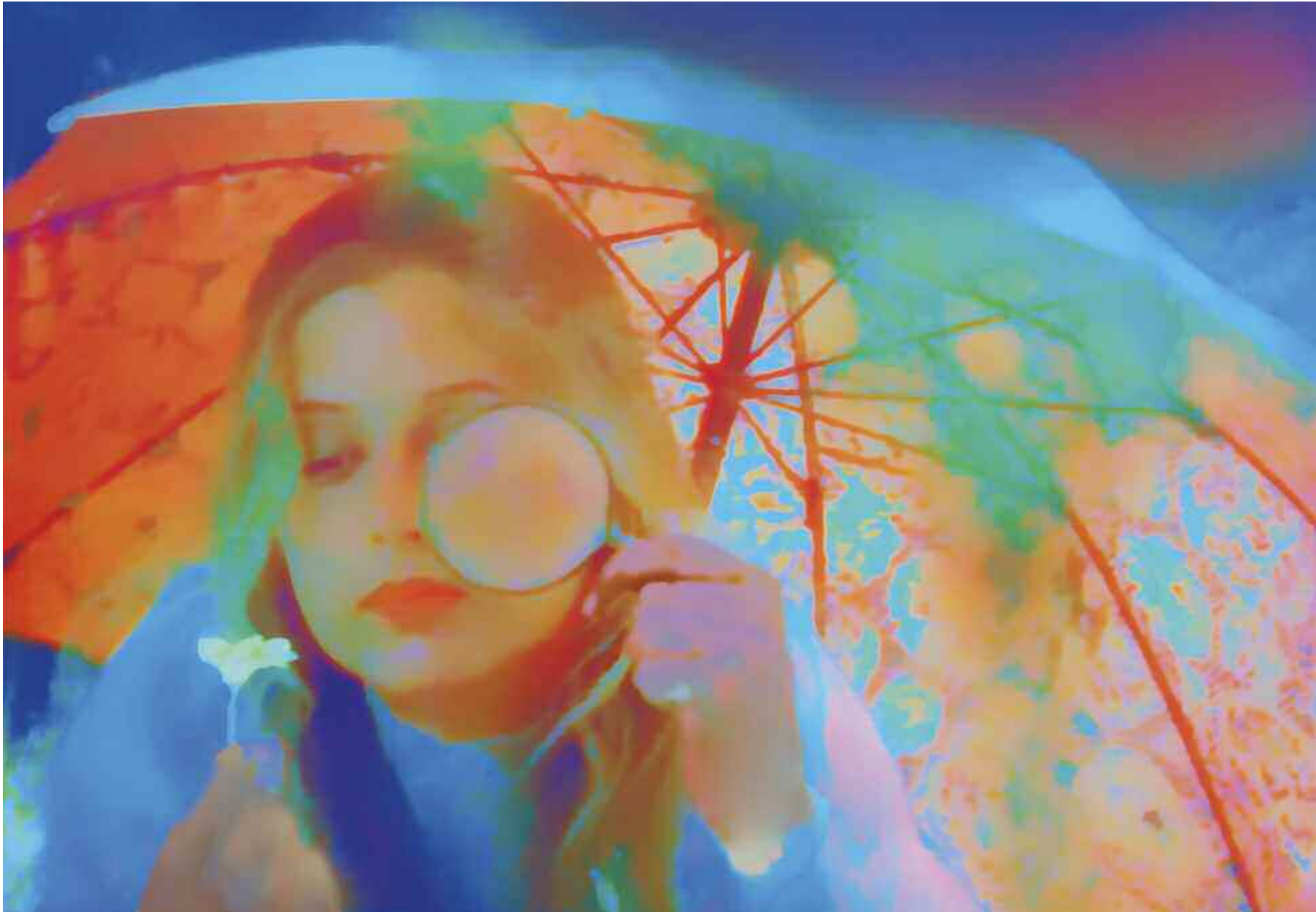
WHY MOUNTAINS ARE HIGH (Picnic at Hanging Rock / Peter Weir), 2013 C-Print. Acrylic/Aludibond. 100 x 145 cm. Signed, titled, dated verso. Limited Edition 3 + 2 AP