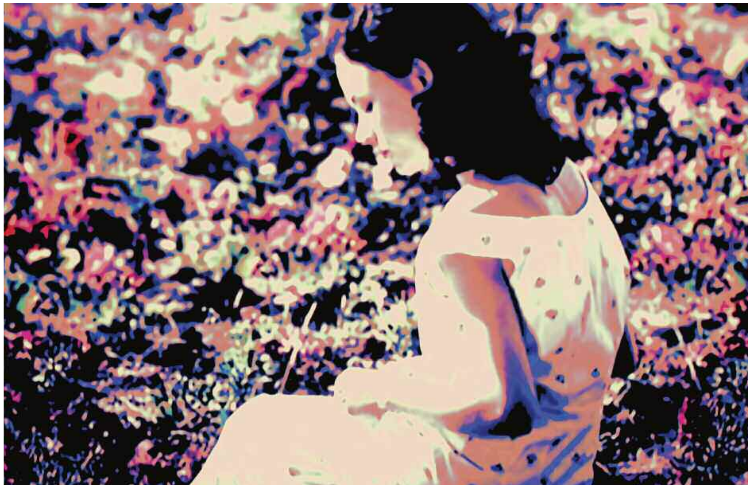
VALLEY OF GIRLS (Women without Men / Shirin Neshat), 2013 C-Print. Acrylic/Aludibond. 70 x 109 cm. Signed, titled, dated verso. Limited Edition 3 + 2 AP