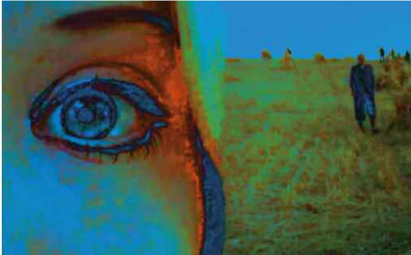
LIFE LOOKING BACK AT YOU (Days of Heaven / Terrence Malick). 2013 C-Print. Acrylic/Aludibond. 100 x 160 cm. Signed, titled, dated verso. Limited Edition 3 + 2 AP