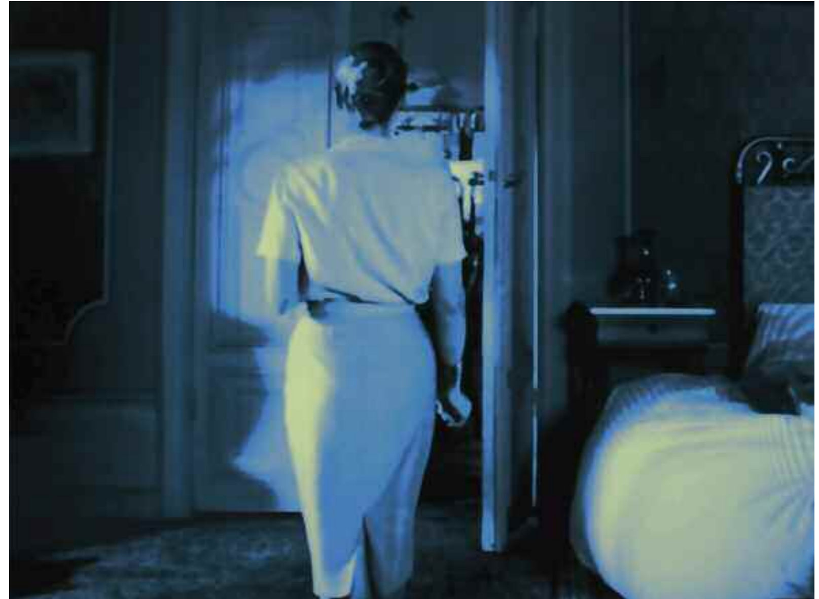
Folgende Doppelseite: CAVALIERI'S PRINCIPLE (Die Klavierspielerin / Michael Haneke). 2013 C-Print. Acrylic/Aludibond. 90 x 136 cm. Signed, titled, dated verso. Limited Edition 3 + 2 AP