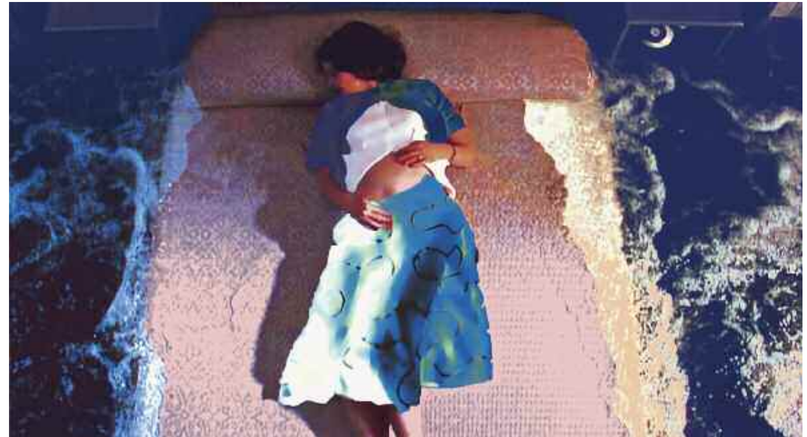
OCEANIC FEELING (The Hours / Stephen Daldry). 2013 C-Print. Acrylic/Aludibond. 70 x 128 cm. Signed, titled, dated verso. Limited Edition 3 + 2 AP