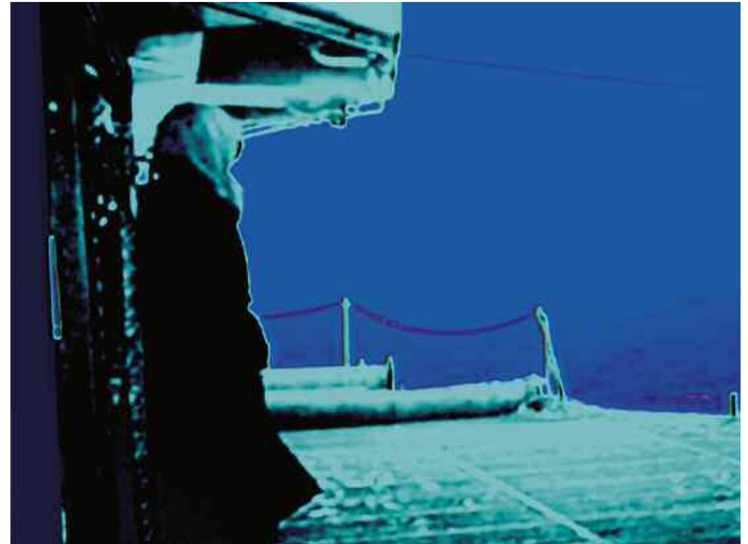
FUKUSHIMA (Rote Wüste / Michelangelo Antonioni), 2011 C-Print. Acrylic/Aludibond. 75 x 100 cm. Signed, titled, dated verso. Limited Edition 3 + 2 AP