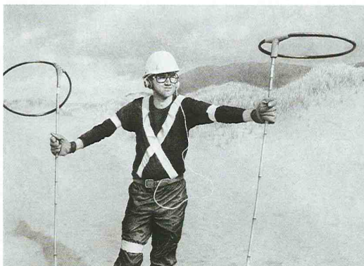
Ethan Murrow, Pierpont spent hours ironing his new Signal Captain uniform and getting ready to be photographed , 2006, crayon sur papier, 152 x 244 cm (LA GALERIE PARTICULIÈRE, PARIS).

« HOMMAGE À MIDRAG DJURIC, DADO-AUTOUR DE TROIS GRANDS TRIPTYQUES », galerie Jeanne-Bucher, 53, rue de Seine 75006 Paris 01 44 41 69 65 www.jeanne-bucher.com du 24 mars au 14 mai.